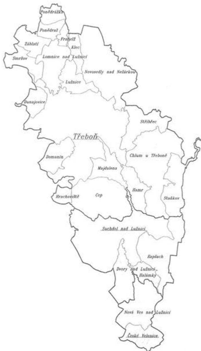
Obr. 12-1 Správní obvod obce s rozšířenou působností Třeboň