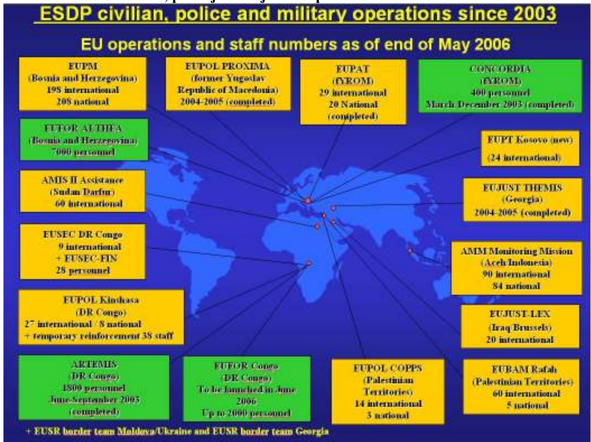
Obrázek 4: Civilní, policejní a vojenské operace v rámci EBOP od roku 2003 ESDP civilian, police and military operations since 2003