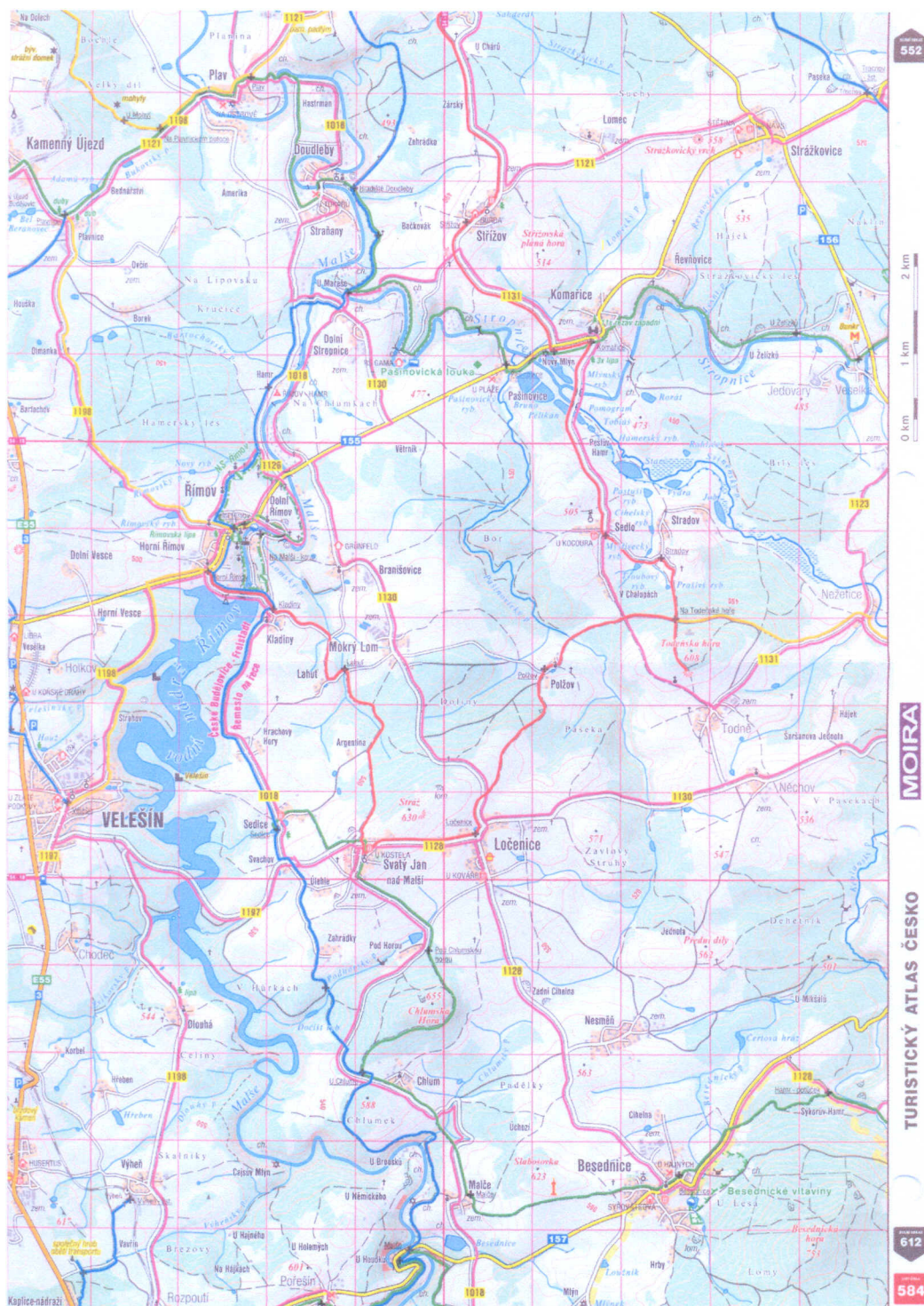
Mapa 2. Obec Svatý Jan nad Malší a okolí