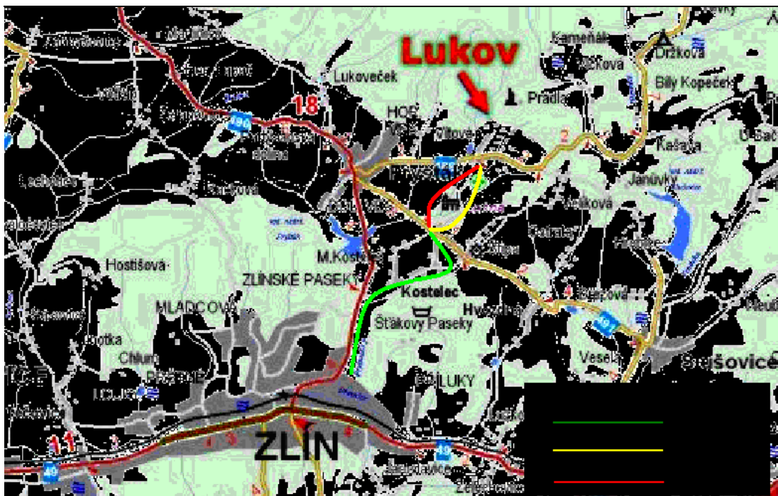
Mapa č. 2: Mapa cyklostezky

Dosavadní cyklostezka vedla z městské části Vršava k ZOO Lešná a její cena byla za 1 metr 2 215 Kč. Celkově se tak cena vyšplhala na 21 817 750 Kč za 9.850 metrů. Dokončení nebo spíš návaznost na tuto stávající stezku by stála zhruba 6 312 750 Kč, neboť Lukov je vzdálen od Lešné 2850 metrů. Tato cyklostezka by znamenala lepší propojení Lukova se Zlínem, neboť hodně lidí dojíždí do práce na kole a navíc na jaře, v létě a na podzim se řada občanů ráda věnuje procházkám, jízdě na kole, kolečkových bruslích, atd. Cyklostezka by mohla také přispět k tomu, aby ji Lukov mohl využívat pro svůj turistický rozvoj a přitáhl by tak do obce nové zájemce o poznání téhle obce.