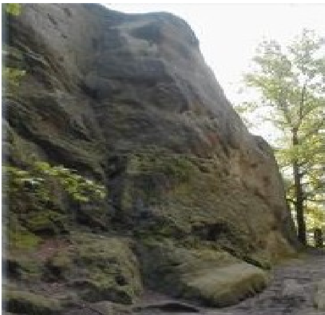
Obrázek č. 7: Skalní útvar Králky