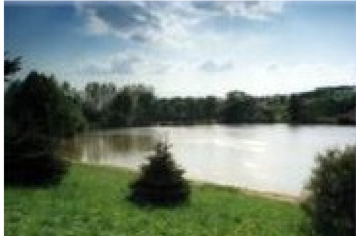
Obrázek č. 5: Lukovské rybníky

Také bych se rád zmínil o dvou rybnících, které má od obce Lukov pronajat Moravský rybářský svaz. Lukov by mohl vypovědět smlouvu a vzít si tyto dva rybníky, jejichž název je Januštice 1 a Januštice 2, do svého opatrovnictví a zavést rybolov i pro rybáře, kteří nemají povolení k lovu ryb. Tím mám na mysli lov na permanentky.