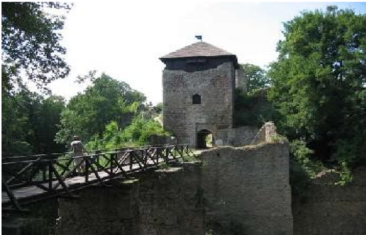
Obrázek č. 2: Vstupní brána na Lukovský hrad po rekonstrukci roku 2005