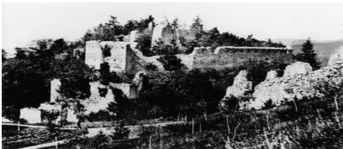
Obrázek č. 1: Hrad roku 1920

Lukova vzdáleno 14 kilometrů. Tímto místem je soustava skalní masy, na kterou je však velmi špatný přístup. Je tedy spíše pro odvážné a fyzicky zdatné. K této skále se také traduje pověst. Od této pověsti dostal tento útvar svůj název. Jeho název jsou Králky.