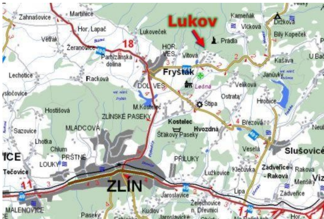
Mapa č. 1: Mapa lokality

Je nutné, abych upřesnil polohu obce Lukov, aby nedošlo k omylu, neboť v České republice existuje 6 obcí se stejným názvem. Obec Lukov leží v nadmořské výšce 316 m.n.m. na jižní Moravě nedaleko od města Zlín a městečka Fryšták. Město Zlín je zároveň krajským městem. Tento kraj má široké spektrum krajinné scenérie, folkloru, historických i technických památek. Žádná turistická oblast nedokáže nabídnout současně hory, manýristickou zahradní architekturu, lázně či vinobraní. Obec Lukov je od Zlína vzdálena zhruba 14 kilometrů. Je soustředěná do kopcovité oblasti Hostýnských vrchů. Jedná se o velmi půvabnou, malou vesničku situovanou do krásného prostředí.