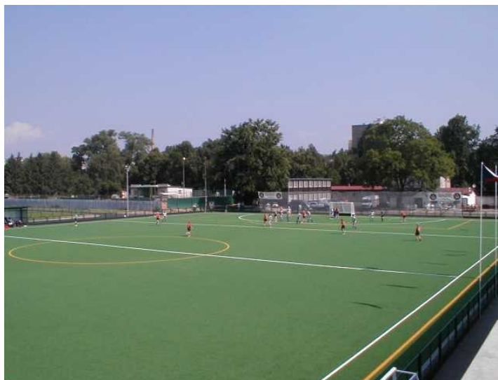
Obrázek č. 4: Hřiště s umělým povrchem

Toto hřiště by mělo splnit veškeré požadavky svého investora, provozovatele a umožnit jeho využívání po celý rok. Jeho návštěvníci budou určitě nad míru spokojeni a rádi se budou na tohle místo vracet. Poskytne jim totiž perfektní zázemí pro jejich sportovní aktivitu a relaxaci.