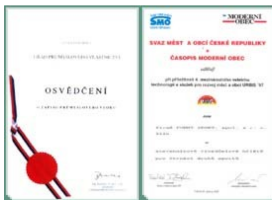
Obrázek č. 3: Cena od Svazu měst a obcí ČR a časopisu Moderní obec

V rámci mezinárodního veletrhu URBIS'97 jim byla za tyto hřiště udělena cena od Svazu měst a obcí ČR a časopisu Moderní obec. Z hlediska bezpečnosti provozu vyhovuje hřiště ČSN 1176 a má bezbariérový přístup.