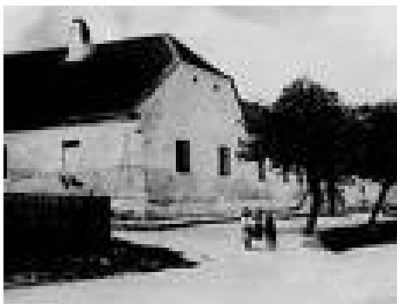
Obrázek č. 8: Budova bývalého obecního úřadu roku 1913

V obci Lukov se nachází řada takových objektů, které by mohly posloužit mému návrhu na výstavbu hotelu. Rád bych se zaměřil na jednu z nich, která mi připadá reálná.