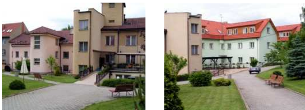
Obrázek č. 1 - Domov pro seniory Boskovice [20]

Celkový počet obyvatel k 31.12.2006 – 162 obyvatel