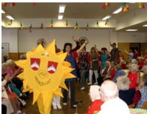
Obrázek č. 2 – Akce konaná DPS Boskovice – Buchtobraní března 2007 [20]

Dvakrát ročně jsou organizovány zájezdy (jaro, podzim). Zúčastňují se jich pohybově schopní klienti za doprovodu zdravotnických pracovníků. Jedná se o návštěvy zámků nebo zajímavých zařízení a končí se posezením v restauraci. Během letního období pořádá Výbor obyvatel táboráky s občerstvením a hudbou na ústavní zahradě. [15]