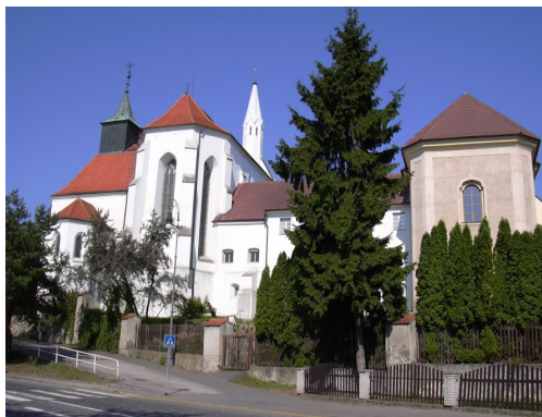
Obrázek č. 4: Kostel sv. Jana Křtitele