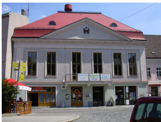
Obrázek č. 10: Kulturní dům Střelnice