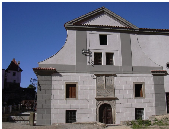
Obrázek č. 9: Mlýn