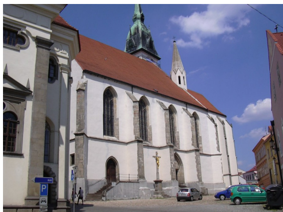
Obrázek č. 5: kostel Nanebevzetí Panny Marie