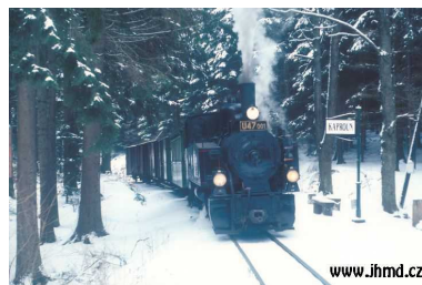
Obrázek č. 8: Parní lokomotiva II