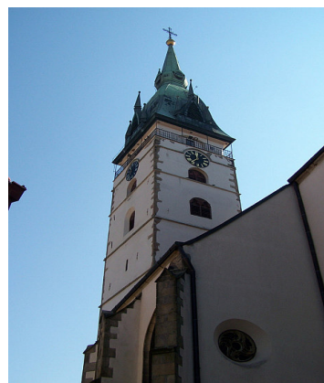
Obrázek č. 6: Městská věž