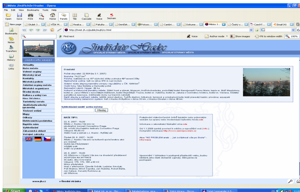
Obrázek č. 11: Ukázka hlavní stránky města – www.jh.cz