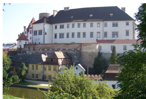
Obrázek č. 3: Pohled na Státní hrad a zámek