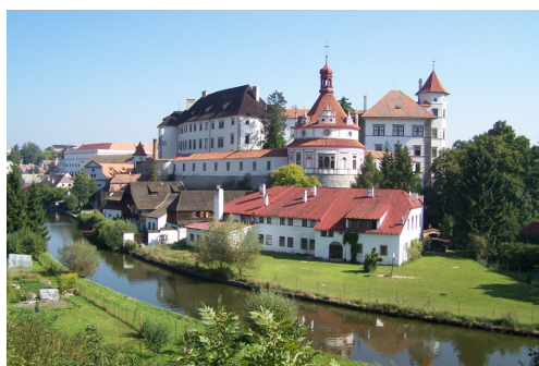
Obrázek č. 2: Pohled na zámecký komplex