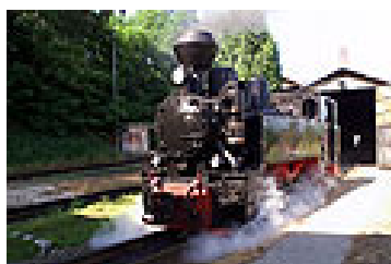
Obrázek č. 7: Parní lokomotiva

Ve všech vlacích úzkokolejné dráhy je povoleno přepravovat zavazadla a jízdní kola. Existují i týdenní traťové jízdenky pro jízdní kolo. Ceny se poté odvíjejí podle toho, zda využijeme vlak motorový nebo parní. V parním jsou ceny vždy o něco vyšší, rozdíl však není tak výrazný, aby se turisté museli rozhodovat mezi cenou a jedinečným zážitkem svést se v parním vlaku. [22]