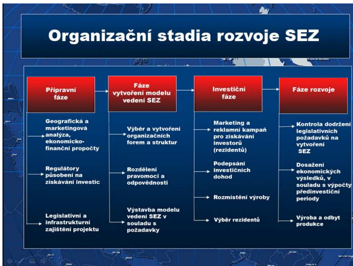
Obrázek 2. Organizační stadia rozvoje SEZ