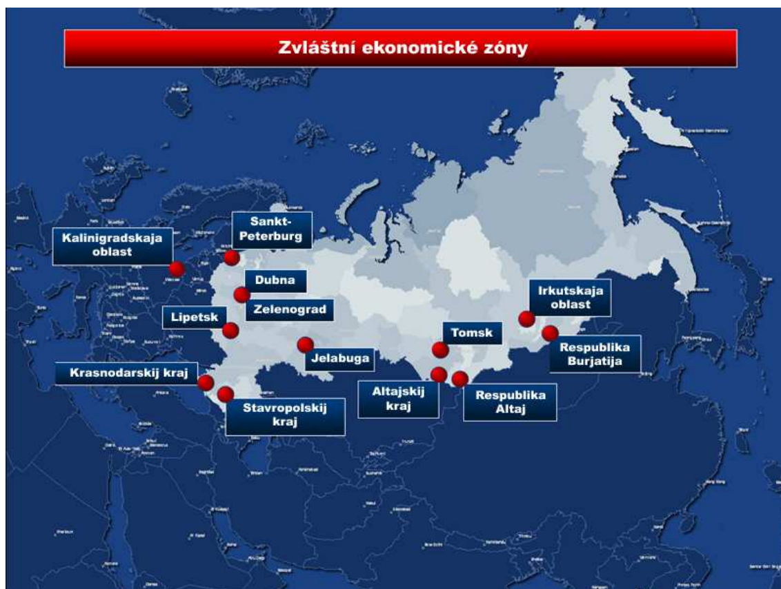
Obrázek 3. Zvláštní ekonomické zóny v Ruské Federaci