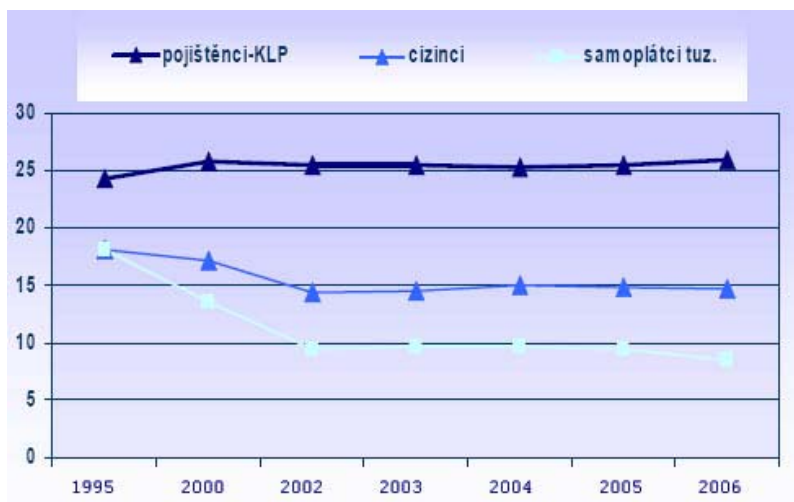
Graf 1. Průměrná doba pobytu v českých lázeňských zařízeních 1995-2006

Zdroj: Inspektorát lázní a zřidel MZ ČR, dostupné z URL: < http://www.mzcr.cz > [online] [2008-01-28]