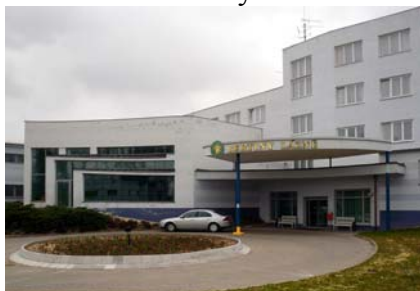
Obr. č. 1. Bertiny lázně

Ubytovací kapacita Bertiných lázní je v současné době 180 lůžek v jednolůžkových či dvoulůžkových pokojích a apartmánech. Vybavenost pokojů odpovídá první kategorii hotelového ubytování. Kapacita je nedostatečná a tak lázně zajišťují i ubytování mimo hlavní budovu v tzv. dependantech. Jde o ubytování v třeboňských penzionech a hotelích např. Hotely Zlatá hvězda, Myslivna, Bílý koníček aj.