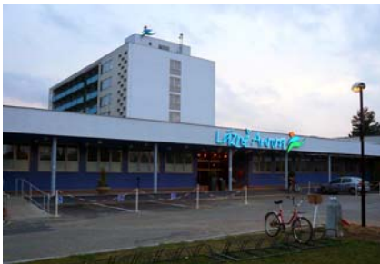
Obr. č. 2. Lázně Aurora