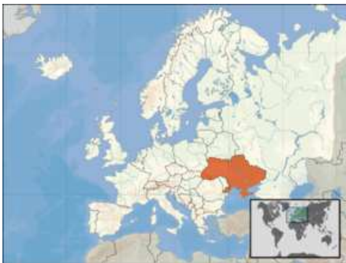
Obrázek 5: Ukrajina na mapě Evropy