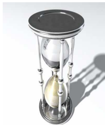
Obrázek č. 13 Čas

Co se týče pojetí času, tak díky středovýchodnímu fatalizmu a historickým událostem spojeným se vznikem Izraelského státu, se na čas pohlíží jinak než na Západě. Na jedné straně Izraelci vedou každé obchodní jednání jakoby to bylo jejich poslední, a k tomu ve stylu „time is money“. Na druhé straně rychlost uzavírání obchodů v Izraeli je obvykle pomalejší než na západě, protože středovýchodní obchodní schůzky obvykle mají pomalejší začátek, hlavně kvůli tradici vyptávání se na zdravotní stav a průběh cestování návštěvníků. Navíc v izraelské obchodní kultuře obvykle trvá dost dlouho, než se partneři konečně dohodnou, což je dáno ještě dávnověkou obchodní tradicí.