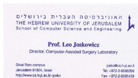
Obrázek č. 11 Navštívenka