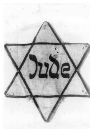
Obrázek č. 3 Holocaust