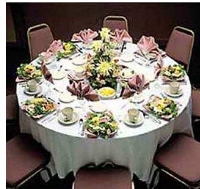
Obrázek č. 14 Stolování

Když jsme pozvaní na společenský podnik, musíme vzít to pravé oblečení a přijít včas. Je taky běžné pro hostitele vyzvednout hosta z hotelu. Za pozvání poděkujeme a to někdy i písemně. Jestliže nemůžete přijít, tak se zdvořile omluvíme. Jestli jsme zvaní na specifickou událost, tak raději napíšeme osobní dopis hostiteli.