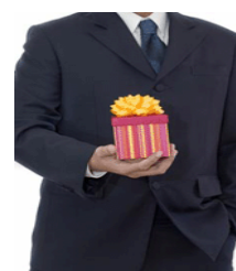
Obrázek č. 12 Dar

Darování v Izraelském obchodním styku není něčím, co můžeme zpravidla očekávat, ale pokud k tomu dojde, tak zpravidla Izraelci mají tendenci přehánět s jejich dary, což někdy vytváří problematickou situaci v obchodní sféře. Proto v mnoha společnostech a organizacích se drží zásady „only business and nothing more“ (jenom byznys, a nic jiného) a žádné darování nebo přijímání daru není dovoleno. Přijatelné dary jsou obchodní propagační materiály s logem společnosti.