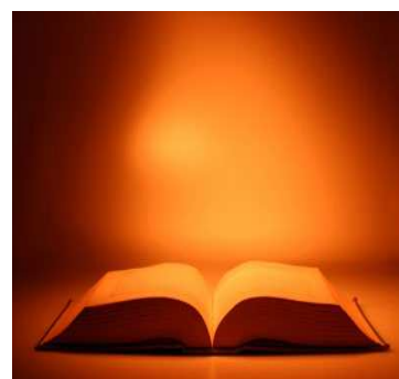
Obrázek č. 9 Starý zákon

Existuje další významný aspekt vztahu k jinověrcům: starost o jejich lidskou, náboženskou i národní důstojnost. Při vyžadování: „neubližujte se navzájem“, Tora zvláště podtrhává: „neubližuj i cizinci“ 51 . U požadavku k dobrému chování k jinověrcům Tora apeluje k historické paměti židovského národa: „A když bude žít u tebe cizozemec v zemi vaší, neutlačuj ho. Jako domorodec mezi vámi ať bude cizozemec, obývajících u vás; miluj ho, jak samého sebe, jelikož jak