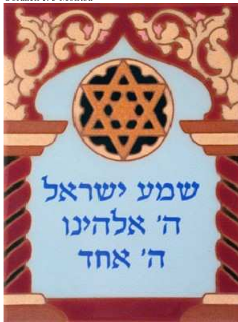
Obrázek č. 5 Molitba

Hlavním předpokladem judaizmu je víra v jednoho boha (monoteismus). Zastara tato víra oddělila židy od jejich sousedů, domnívajících se, že úroda, deště, nemoci, narození dětí a smrt jsou pod kontrolou různých bohů. Dnes monoteismus zastávají také mnohé další národy. Monoteismus – to je víc než jen víra, je to světonázor, vnímání světa. Jelikož Židé jsou monoteisti, tak považují lidi, stromy, květiny, hory – celou přírodu – jako dílo jednoho Boha. Toto přesvědčení předělá jakékoliv vizuální, sluchové a jiné vnímání v setkání s bohem. Monoteismus udává provázanou nerozdílnost a spojitost života.