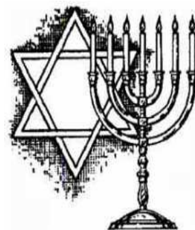
Obrázek č. 2 Menora

Středověká Evropa patřila ke křesťanskému světu. Bylo to období vládnutí církve a aristokracie, i když církevní moc byla mnohdy silnější. Byly to těžké časy pro židovský národ poněvadž v nejlepším případě je prostě nesnášeli, v horším – vyvražďovali. Ve Středověké Evropě židé nebyli pojmenováni jinak než vrahy Ježíše. Často se schvalovaly zákony, ponižující Židy nebo omezující jejich svobodu. Někdy Židé byli nuceni žít v ghettu: jednotlivých čtvrtích, okroužených stěnou s branou, uzavřenou v noci.