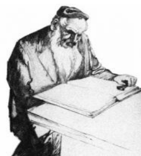
Obrázek č. 1 Rambam

Tato část by měla obsahovat nejen informaci o Židech ale i o jejich náboženství – judaizmu. Judaizmus není jenom náboženstvím, ale je i stylem života. Ne všichni Židé ho akceptují a dodržují stejným způsobem, není pravidlem, že každý Žid by dnes chtěl a uměl být Jehudi (nositel toho pravého židovského náboženství).