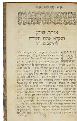
Obrázek č. 8 Agadat Timan

Jedno z nejvíce rozšířených definic krádeže je pokus o odebrání něčeho cizího, neboli vzít věc bez povolení majitele. Nicméně toto určení je příliš obecné, a proto nepřesné. Podle židovského názoru, existuje rozdíl mezi situacím, kdy vezmeme něco malého, jako je např. tužka ze stolu vlastního otce, což se nepovažuje za krádež. Však když z otcovské peněženky vezme tisícikorunu, to už je považováno za trestný čin. Otázkou je, zda pojetí krádeže závisí na hodnotě. Židovská legislativa odpovídá, že neexistuje jakási minimální cena, pod kterou ten čin není krádeží, že suma nemá význam, pokud byla uskutečněna právě krádež 36 .