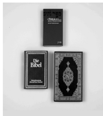
Obrázek č. 7 Náboženství

Konkrétně Židé nahlízejí na Islám jak na čistě monoteistické učení, a islámskou přísnou mravnost přiměřenou zákonům synů Noa. Postoj Židů ke křesťanům nebyl nikdy jednoznačný. I když Židé akceptují vysoké mravní zásady křesťanství, nesouhlasí s tvrzením o tom, že Kristus je Bohem. Ve středověku židovští mudrci projednávali otázku, zda sloužení Kristu je idolatrie. I přesto, že bylo rozhodnuto, že to není idolatrie, Židé nepřiznávají křesťanství čistým monoteizmem.