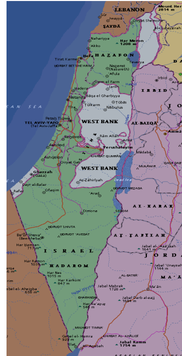
Obrázek č. 4 Mapa Izraele

V letech 1945-1948 byli mnozí Židé, kterým se podařilo přežít Holocaust, rozmístěni v „táborech pro přemístěné osoby“. Po nějaké době část z nich dostala povolení k usídlení v Palestině, která byla pod vládou Británie. Nicméně osídlení se provádělo velice pomalu a Židé navíc museli překonat silný odpor ze strany arabských vlád sousedních zemí. Tím byl položen začátek nepřátelství mezi palestinskými Židy a britskou vládou. V květnu 1948, Británie odvolala svoji armádu z Palestiny. Den předem Židé Palestiny prohlásili vznik samostatného státu Izrael. V ten samý moment se začala invaze sousedních arabských států, které odmítali založení židovského státu na území Izraele. V této válce, zvanou „Válkou o nezávislost“, zvítězil Izrael.